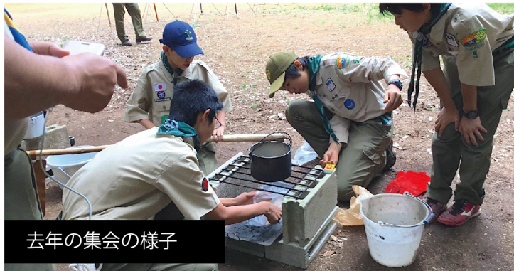
去年の集会の様子

ボーイ隊 三枚おろし おうちで出来る進級課目の予習をスカウトへ伝え、保護者へ料理のお手伝いをお願いしました。スカウトから技能章「野外炊事章」魚の三枚おろしを挑戦した報告を受けましたのでご紹介します。 隊長「この休みの間、何か挑戦しましたか？」 スカウト「魚さばきました。三枚おろしです。」 隊長「うまくいきましたか？」 スカウト「背骨を切断しました。三枚は微妙ですが出来ました。」 隊長「背骨切断！何回もさばいていけばうまくなっていくよ！また挑戦だね。」 スカウト「はい！」 うちの中でも出来る活動はありますが早くスカウトみんなで活動したいみたいです。 次回は野外料理。隊集会メニュー決りをG会議（オンライン会議）でしていきます。